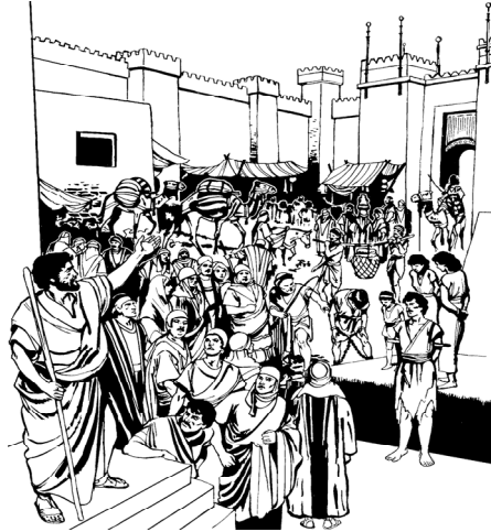
Yunus babicara pa orang-orang di kota Niniwe

6 Waktu raja Niniwe dengar tu brita, dia turung dari kadera raja, kong ganti de pe baju krajaan deng kaeng karong. Klar itu dia dudu di abu, tanda so tobat. 7 Tu raja deng de pe pejabat-pejabat kase kaluar prenta bagini, "Samua orang deng tu binatang ja piara: sapi, kambing deng domba, nimbole makang deng minung. 8 Samua orang deng tu binatang ja piara musti pake kaeng karong. Samua orang musti basombayang pa Allah deng sunggu-sunggu. Musti roba tu kalakuan jaha, kong brenti tu beking-beking kakrasan. 9 Sapa tau Allah nyanda mo mara lei pa torang, kong Dia babale sayang sampe torang nyanda mo mati."