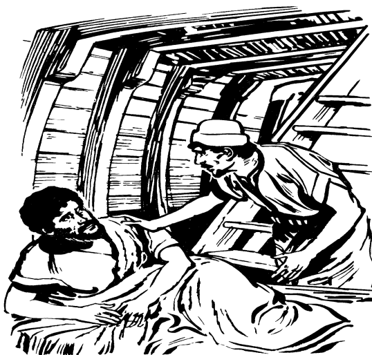
Kapten kapal kase bangong pa Yunus

Waktu itu, Yunus ada di dek paling bawa, dia da baguling sampe tasono di situ. 6 Kong kapten kapal turung ka bawa, dia dapa lia pa Yunus kong bilang, "Bagimana lei ngana cuma da tasono sadap? Bangong jo, kong pi minta tolong pa ngana pe tuhan, sapa tau dia mo kase slamat pa torang supaya torang nyanda mati!"