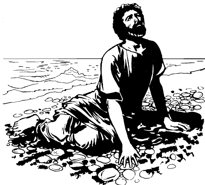
Yunus tadampar di pinggir pante

8 Ada tu orang-orang yang cuma percaya pa opo-opo tu nyanda barguna. So dorang no, tu da kase tinggal pa TUHAN yang nyanda brenti sayang pa dorang. 9 Mar kita, kita mo kase korban persembahan pa TUHAN deng ucapan syukur. Kita mo beking samua tu kita pe janji pa TUHAN. Memang tu keselamatan cuma dari pa TUHAN!"