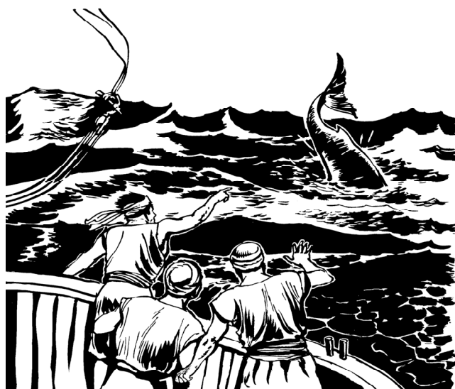
Iking basar pi tlang pa Yunus

17 Waktu itu jo TUHAN suru ikang basar pi tlang pa Yunus, kong Yunus tinggal di dalang ikang pe puru tiga hari tiga malang.