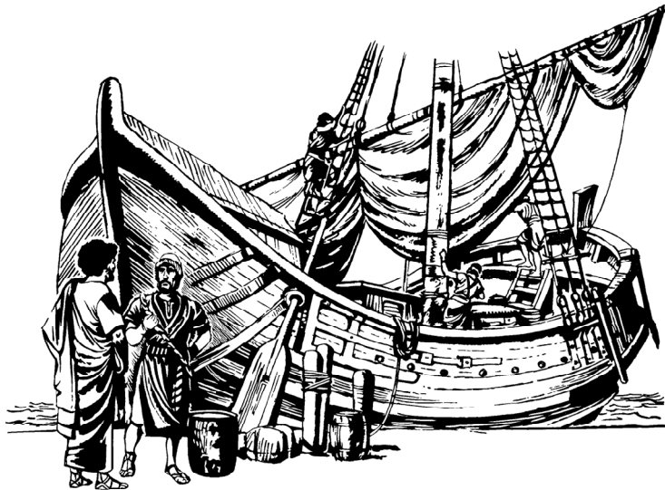
Yunus nae kapal for mo pi ka Tarsis

3 Mar Yunus nimau, dia cuma mo lari ka Tarsis lantaran mo bajao dari pa TUHAN. Jadi Yunus pigi ka Yafo, kong di sana dia dapa kapal mo ka Tarsis. Abis dia bayar frak, dia nae ka kapal for mo blayar ka Tarsis, supaya jao dari TUHAN.