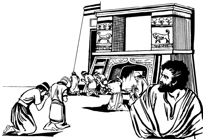
Samua orang di kota Niniwe bertobat

6 Waktu raja Niniwe dengar tu brita, dia turung dari kadera raja, kong ganti de pe baju krajaan deng kaeng karong. Klar itu dia dudu di abu, tanda so tobat. 7 Tu raja deng de pe pejabat-pejabat kase kaluar prenta bagini, "Samua orang deng tu binatang ja piara: sapi, kambing deng domba, nimbole makang deng minung. 8 Samua orang deng tu binatang ja piara musti pake kaeng karong. Samua orang musti basombayang pa Allah deng sunggu-sunggu. Musti roba tu kalakuan jaha, kong brenti tu beking-beking kakrasan. 9 Sapa tau Allah nyanda mo mara lei pa torang, kong Dia babale sayang sampe torang nyanda mo mati."