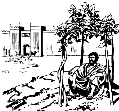
Tu tanaman da kase basombar akang pa Yunus

5 Abis itu, Yunus kaluar dari tu kota, dia pigi ka satu tampa di sabla timur. Di situ dia beking sabua kacili for tampa basombar. Dia dudu di sabua itu kong batunggu mo lia apa tu mo jadi di Niniwe.